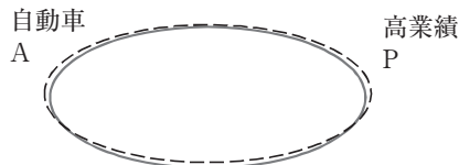
図2. 「自動車企業はそれぞれのやり方で高業績を継続している」状況 (著者作成)

(2)自動車産業の中で高業績Pであることと、ある事業で工夫をしていること(カンバン方式K)との大小関係は、「反例」b社がないとわからない。「反例」がないと、実は自動車業界の会社については、 A \cap K がPと一致しているかもしれない(図2)。もしそうなら、b, b1, b2社のような会社は存在せず、Kという条件を調べることは高業績を継続できる戦略的な意味がない。自動車企業が高業績をあげるための条件はKではなく、自動車企業なら高業績である。Kを持ち出す意味がない。