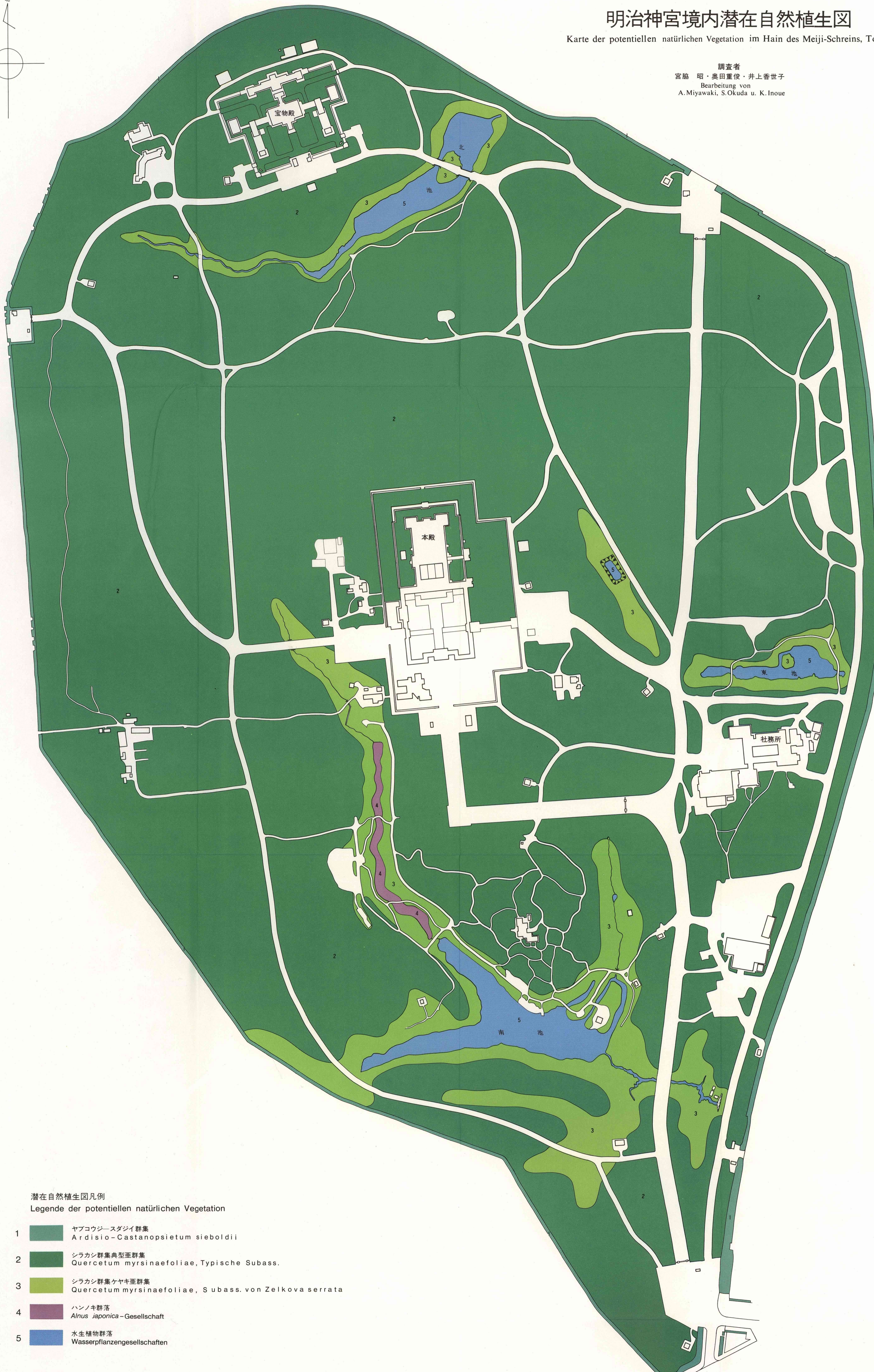
潜在自然植生図凡例 Legende der potentiellen natürlichen Vegetation