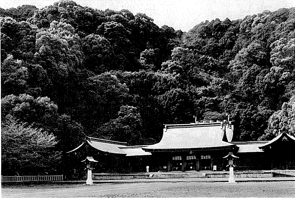
Fig. 2 静岡市内護国神社境内に茂る常緑広葉樹林（海拔12m）。 Ein immergrüner Laubwald ist hinter dem Shinto-Schrein Gokokuji entwickelt (In der Stadt Shizuoka 12m ü. NN.).

来の自然植生としては一部十里木付近くにブナ林が残されている。同様に赤石山系にも海拔700～800mまでの南斜面は海岸からすべて冬も緑の常緑広葉樹に被われていたヤブツバキクラス域で占められている。とくに海岸沿いや河川下流の沖積低地はイノデータブノキ群集に象徴されるタブ林が発達している。タブ林域の多くは現在水田として利用されているところが多い。海岸から内陸に10～20kmまでの丘陵や台地の肩部などで比較的乾燥しやすい、あるいは旧砂丘などではヤブコウジースダジイ群集で代表されるスダジイ林が広い範囲で発達している。一部静岡県西部のイノデータブノキ群集の内陸側での土壌の深いところでは紀伊半島から続いて分布しているルリミノキーイチイガン群集、土壌のよい西部ではホソバカナラピースダジイ群集も占めている。内陸の土壌の深い台地上は広くシラカン群集で占められている。しかし富士山麓や赤石山脈の南端にあたる海拔700～800m周辺の尾根状地や急斜面ではウラジロガン、アカガンに、しばしば尾根部ではモミが優占しているシキミーモミ群集によって占められているところも少なくない。河川ぞい溪谷地では下流部にムクノキーエノキ群集、山地部ではイロハモミジケヤキ群集などのケヤキ林が現在でも局地的に残存している。しかし海拔700～800から1,600mまでは赤石山系、富士山あるいは伊豆半島も冬は落葉するブナ、ミズナラを主とした夏緑広葉樹林、すなわちブナクラス域によって占められている。富士山の南斜面などで不安定な立地ではクリーミズナラ群集や下部ではクリーコナラ群集などの一部自然林もみられる。しかし現存植生の大部分は薪炭林な